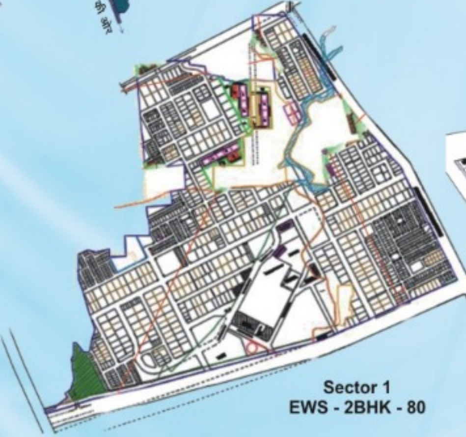
Sector 1 EWS - 2BHK - 80