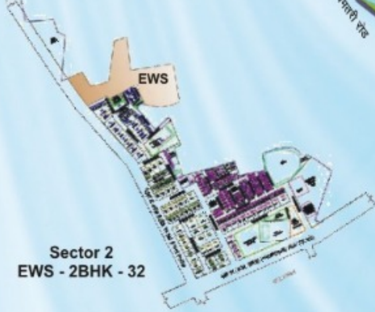
Sector 2 EWS - 2BHK - 32

कमल विहार से दूरी जयस्तंभ - 5 कि.मी. बस स्टैण्ड - 7 कि.मी. रेल्वे स्टेशन - 9 कि.मी. एयरपोर्ट - 9 कि.मी.