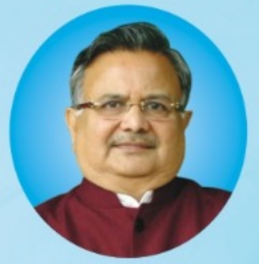
डॉ. रमन सिंह माननीय मुख्यमंत्री, छत्तीसगढ़