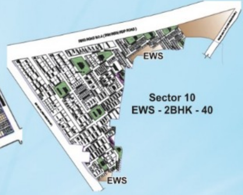
Sector 10 EWS - 2BHK - 40

आवेदन की पात्रता : (1) आवेदक छत्तीसगढ़ राज्य के नगर पंचायत, नगर पालिका, नगर निगम क्षेत्र में 31 अगस्त 2015 की स्थिति में निवासरत हो (2) EWS हेतु पूरे परिवार की अधिकतम वार्षिक आय रु. 3,00,000/- तक (3) परिवार के नाम पर भारत में कहीं भी कोई पक्का मकान नहीं हो.